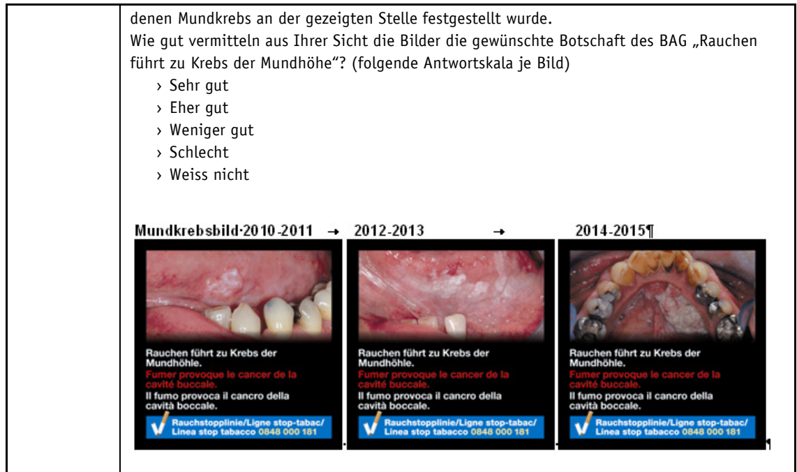
Tabelle 1 Fragebogen Bevölkerungsbefragung (Auszug Tabakfragen).